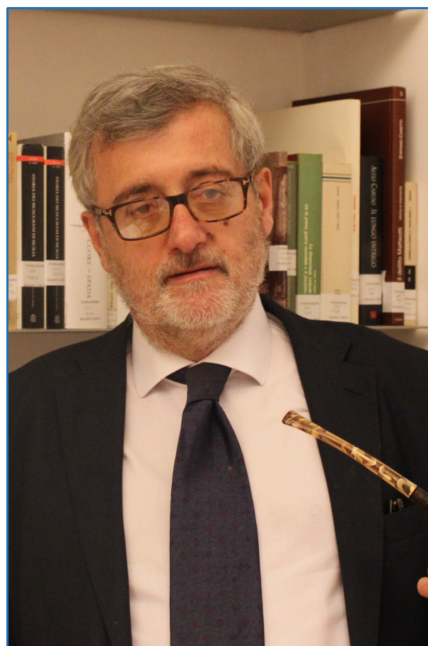
Consigliere della Camera dei Deputati. Coordinatore del Comitato Scientifico della Fondazione Magna Carta.

La centralità parlamentare rappresenta una delle caratteristiche fondamentali della forma di governo che ha caratterizzato l'esperienza della nostra repubblica. Una caratteristica così radicata che nella riflessione comune la centralità parlamentare viene considerata un elemento imprescindibile delle democrazie. In realtà, dando uno sguardo ai principali sistemi democratici del mondo, si può verificare che non si tratta di un valore assoluto quanto piuttosto di una caratteristica che dipende da precise scelte politiche.