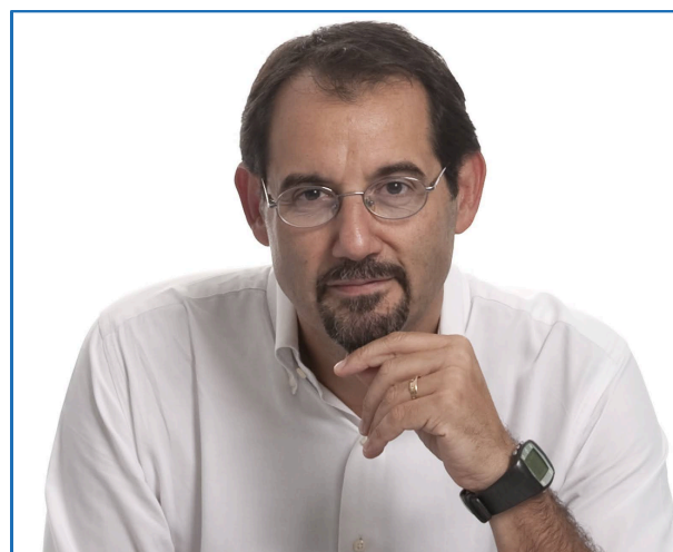
Comunicazione, Marketing e Innovazione WellMakers by BNP Paribas