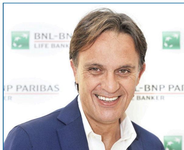
Head of WellMakers by BNP Paribas

Il workshop analizza l'evoluzione delle dinamiche di mercato, evidenziando il passaggio da una filiera lineare a ecosistemi allargati, dove aziende, tecnologie e persone interagiscono in modo innovativo. Il ruolo dei punti vendita si trasforma in spazi di esperienze immersive, mentre la reputazione e i prezzi dinamici influenzano le decisioni d'acquisto. Inoltre, il concetto di benessere si espande verso una dimensione più complessa, con WellMakers by BNP Paribas come esempio di ecosistema digitale che promuove soluzioni personalizzate e sostenibili per la crescita individuale e collettiva.