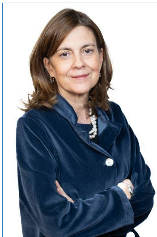
Professore Associato di Storia delle Relazioni Internazionali presso la LUISS Guido Carli di Roma; Direttore del corso di laurea magistrale in Relazioni internazionali presso lo stesso ateneo.

Proporrà delle periodizzazioni e dei momenti di svolta del processo alla luce del più ampio contesto internazionale mostrando quanto quest'ultimo abbia sempre condizionato le decisioni che i paesi Fondatori prima, e i membri entrati durante i vari allargamenti poi, hanno preso.