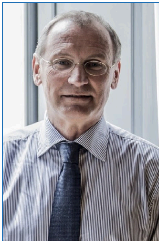
Professore ordinario di Diritto Costituzionale presso la Facoltà di Giurisprudenza dell'Università di Milano Statale; già Vicepresidente della Corte Costituzionale.

Nelle visioni contemporanee, non certo solo in Italia, i rapporti tra legislazione e giurisdizione sono sempre meno caratterizzati dal rispetto del principio della separazione dei poteri: la giurisdizione, non solo quella costituzionale, ha occupato terreni un tempo propri della politica, e quest'ultima non sembra nelle condizioni storiche, politiche e "spirituali" per potersene riappropriare. La lezione, cercando anche un coinvolgimento dei partecipanti, prova a sviluppare una riflessione su tutto questo.