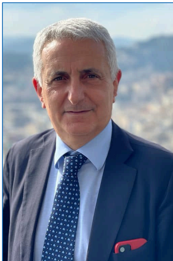
Professore Ordinario di Storia Contemporanea della LUISS Guido Carli di Roma, Dean della School of Government presso lo stesso ateneo e Presidente della Fondazione Magna Carta.

La lezione evidenzierà le continuità e le rotture tra queste quattro grandi stagioni, nonché il loro rapporto con la teoria classica della rappresentanza. Lo scopo è quello di evidenziare se e quando la rappresentanza politica classica sia stata violata a favore del mandato imperativo.